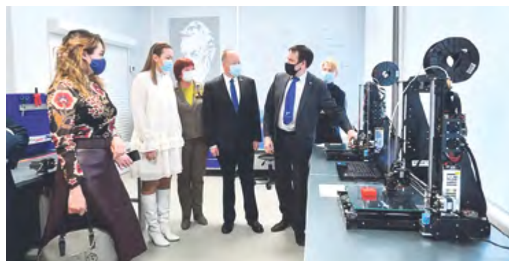
Открытие Дома научной коллаборации