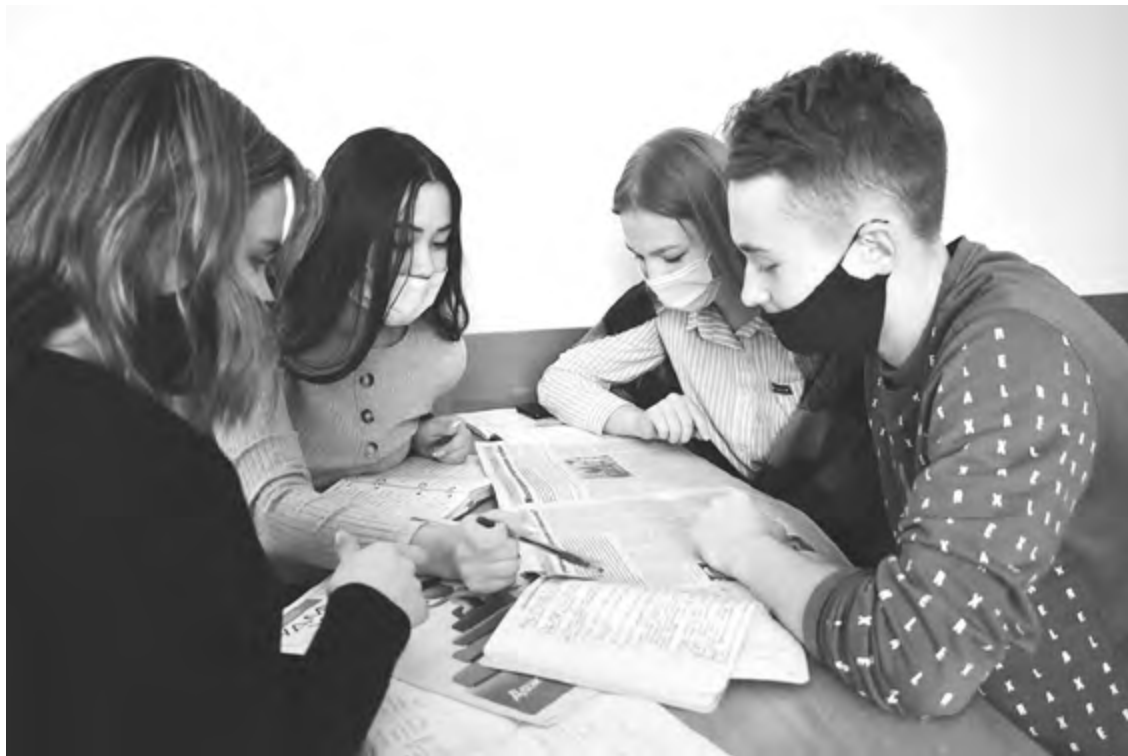
Делать издание – работа интересная. Делать издание дружной и толковой командой – работа классная.

от этой должности, так как вся ответственность ложится на меня. Если кто-то не выполняет задание или отказывается его делать, то мне приходится брать его на себя. Наверно, в этой должности есть плюсы, но так как работа идёт внатяжку, я их пока не увидела. В начале работы над журналом мы распределили обязанности, но команда распалась, и задания пришлось поделить на тех, кто остался. В нашей команде четыре человека: два корреспондента, которые пишут материалы и подбирают к ним изображения, один главный редактор – это я (отвечаю за всю работу, контролирую и поддерживаю рабочий процесс) и один помощник редактора, который является универсальным работником в нашей команде. Задание само по себе очень интересное, но из-за проблем в команде впечатление испортилось».