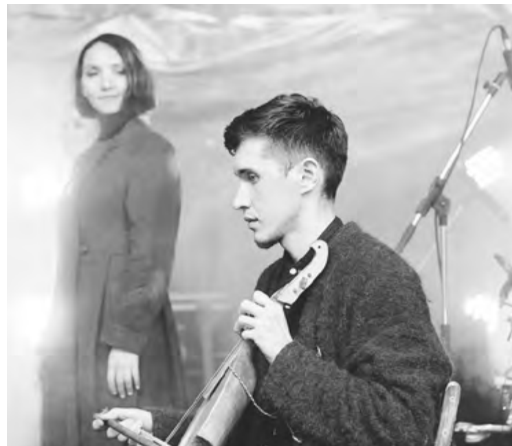
Post Dukes: исполнение народных песен под кубыз.

сердца меломанов. Другой отличительной особенностью Post Dukes является исполнение народных песен под кубыз – восстановленный струнный удмуртский музыкальный инструмент, внешне похожий на скрипку, почти забытый большинством удмуртов вплоть до 80-х годов прошлого века. В основе творчества