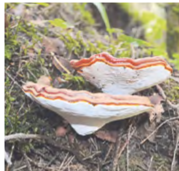
Трутовик лакированный, Красная Книга РФ, Красная Книга Удмуртии (3 категория), Кезский район.

том. У них используется и шкура, и мясо, и жир в медицине, как барсучий и медвежий. Но условия Удмуртии для сурков не самые оптимальные: у нас нет настоящих степей, есть лишь эффекты остепенения в южных районах. Сурки не размножились, как ожидалось, охота на них так и не открылась. Они просто стали небольшим дополнением нашей природы. Какого-то вреда сельскому хозяйству сурки не приносят. Они могут выходить на поля, питаться там зелёной массой, выкапывать всходы. Но зерно они не собирают, запасы не делают, потому что зимой впадают в спяч-