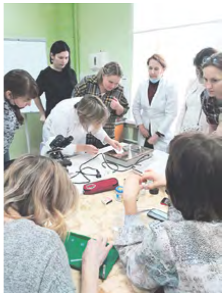
K21 - учителя

чения) и инжиниринг. На каждом уровне – своя степень погружения, опирающаяся, в первую очередь, на школьную базу. Обучают детей 14 квалифицированных преподавателей, и ещё 8 методистов и лаборантов участвуют в подготовке и обеспечении учебного процесса.