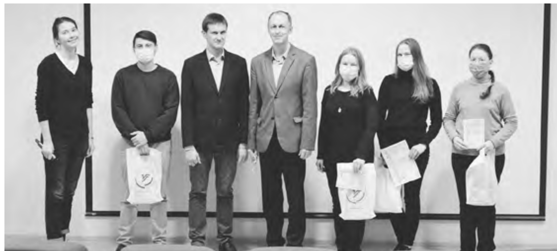
Победители и члены жюри конкурса «Ветер странствий».

Цикл мероприятий к 100-летию государственности Удмуртии открыл флэшмоб, в рамках которого его участникам было предложено прочитать стихотворение об Удмуртии на удмуртском или русском языках. Его