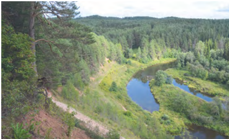
Дебёсский район. Вид с горы Байгурезь.

помещении редакции. Прямо на улицах города можно обнаружить различные трутовые грибы, которые растут на больных деревьях, шляпочные грибы в эту тёплую осень прямо на газонах образовали свои плодовые тела.