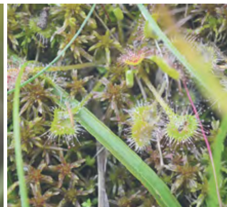
Росянка круглолистная, Красная Книга Удмуртии (2 категория), Кезский район.