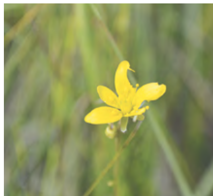
Камнеломка болотная, Красная Книга Удмуртии (1 категория), Кезский район.