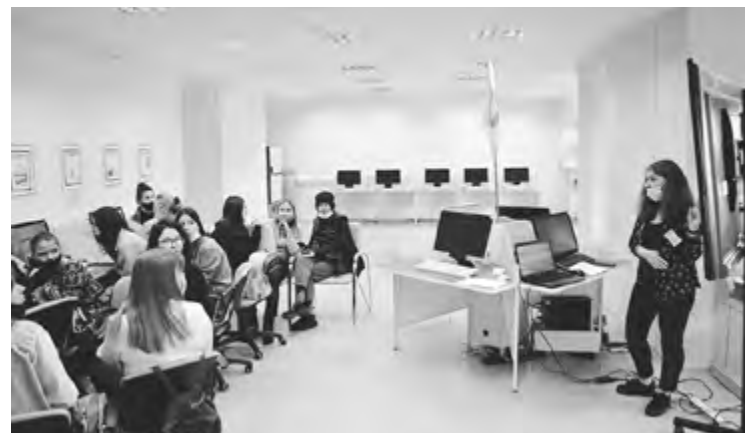
На этой игре использовались ресурсы Президентской библиотеки им. Б.Н. Ельцина.

юзной республики, её духовным наследием, этапами культурного и политического развития. Игроки затронули также вопросы этнического многообразия Удмуртии и её географии. Кроме того, в качестве информационной поддержки к игре в библиотеке действовала одноимённая книжная вы-